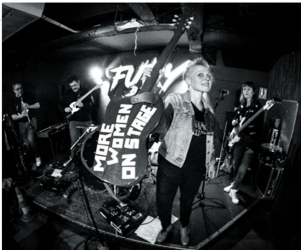
Article de Pierette Pape / Michel n°7 - 2024

Annabelle Lady Arlette Fuckin' Babel Love